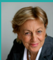
Marylise LEBRANCHU Ministre de la Réforme de l'État, de la Décentralisation et de la Fonction publique