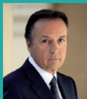
Jean-Pierre BEL Président du Sénat