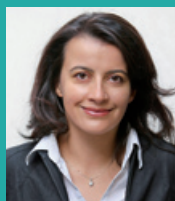
Cécile DUFLOT Ministre de l'Égalité, des Territoires et du Logement